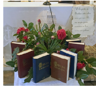
SEMANA ANTERIOR... Igreja de Pereira

A jogar em casa, Jesus não consegue marcar pontos! Nenhum sinal estrondoso, nenhum milagre, como em Cafarnaum. Mas o problema não é «Jesus». É o campo que está minado pelo preconceito e enlameado pela desconfiança. Jesus, mal recebido na sua terra, prefere saltar para as periferias, sair ao encontro dos estrangeiros. Foi assim com Elias, com Eliseu, com Jeremias e os grandes profetas: foram enviados às nações, ao mundo pagão, àqueles de quem menos se esperaria a adesão da fé. Jesus parece indicarnos o público-alvo da nossa missão: ir aos de fora, anunciar a Boa nova aos mais distantes, aos pobres de toda a espécie de pobreza, sobretudo àqueles cuja maior pobreza é desconhecer a Cristo. Mas trata-se de anunciar o Evangelho com a Palavra e, primeiramente, com a vida! Por isso o anúncio não pode desligar-se da prática concreta do amor. Caso contrário, “corre o risco de não ser compreendido, ou de afogar-se num mar de palavras”. Profecia e caridade andam de mãos dadas. Porque - como adverte São Paulo - «sem o amor», nem a plenitude da fé, nem a eloquência da profecia, nem a grandeza da ciência, nem a virtude do sacrifício, valem alguma coisa!